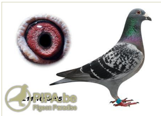
NL11-1013465 The Magic Kannibal

Bij zulke uitslagen horen natuurlijk ook topduiven. Eentje hiervan wil ik er toch even uitlichten: de NL11-1013465 The Magic Kannibal. Deze weduwnaar vloog o.a. de volgende koprijzen: